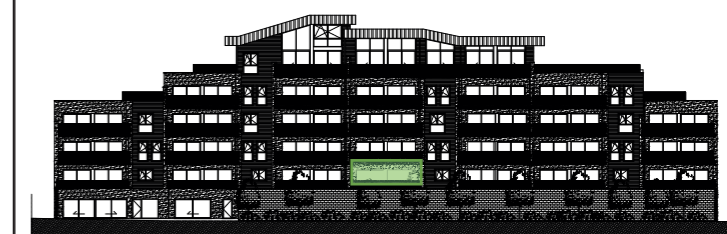
PLAN GENERAL :